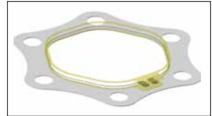
Aufbau des Bruchsenors Construction of the fracture sensor